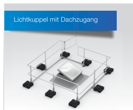
Ausführung mit selbstschließender Türöffnung zur Sicherung von Lichtkuppeln mit Ausstiegsfunktion.