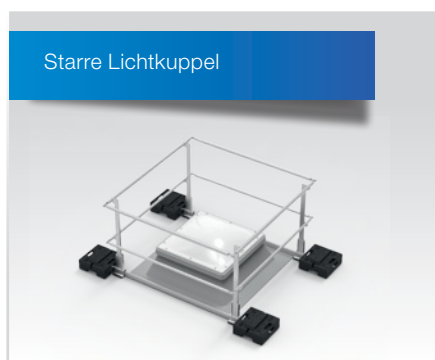
Standardumwehrung für Lichtkuppeln mit Oberlichtfunktion.