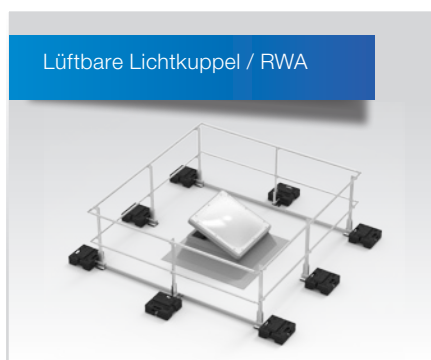
Variante in variablen Größen mit genügend Freiraum für aufklappbare Lichtkuppeln und RWA.